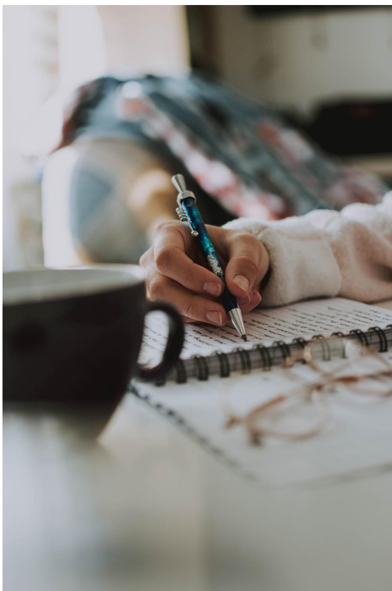
Nota. Foto de lilartsy en Unsplash

alguien tiene la más mínima intención de hacerlo, ¡Que lo haga!, así salga bien o salga mal, porque toda la experiencia ha sido súper bonita, desde el apoyo que he encontrado que me ha permitido conocer mejor a muchas personas a mi alrededor, como es el caso de mi hermana; al proceso de interactuar con la editorial “La Consentida” que hacen las cosas desde la pasión y el idealismo y no por beneficiarse de ellos, sino para