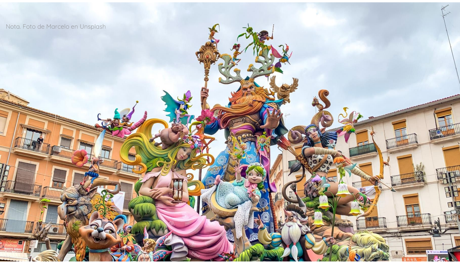
Nota.